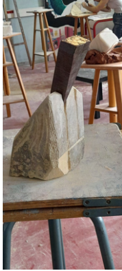
Le veau dort, la religieuse crie , Lotfi Fardeheb

Inventer un geste sculptural pour laisser la trace du geste dans la matière jusqu'à amplifier la forme initiale en fromage avec l'impression de râper du parmesan.